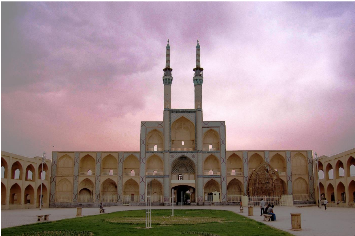
Jameh moskee Yazd

Volle dag bezoek aan Yazd. In de voormiddag bezoek aan Yazd, met de Rokn od Din Moskee, het Mir Chakmaq plein en -moskee; de Heilige Vuurtempel van de Zoroasters, alsook de Jameh-moskee (=de vrijdagmoskee), één der mooiste moskeeën van Iran. Overnachting in Yazd.