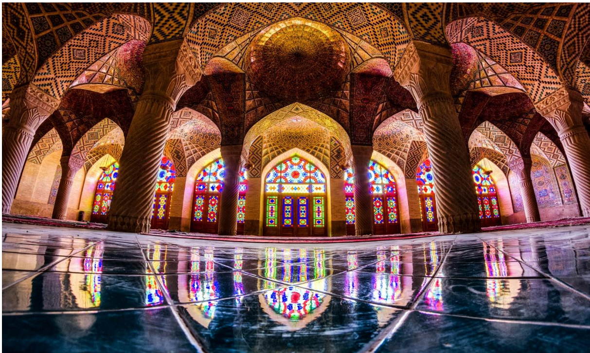
Nasir Ol Molk moskee

Vandaag eerste bezoek aan Shiraz. Bezoek aan een theologische school . Shiraz was in de 14 e eeuw het cultureel en artistiek centrum waar kalligrafie en letterkunde bloeiden. Verder bezoek aan de Nasir al Molk moskee.