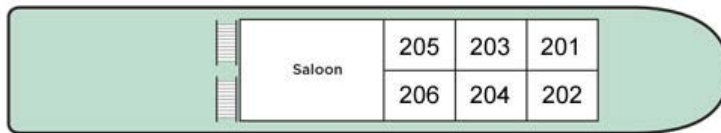
UPPER DECK PLAN