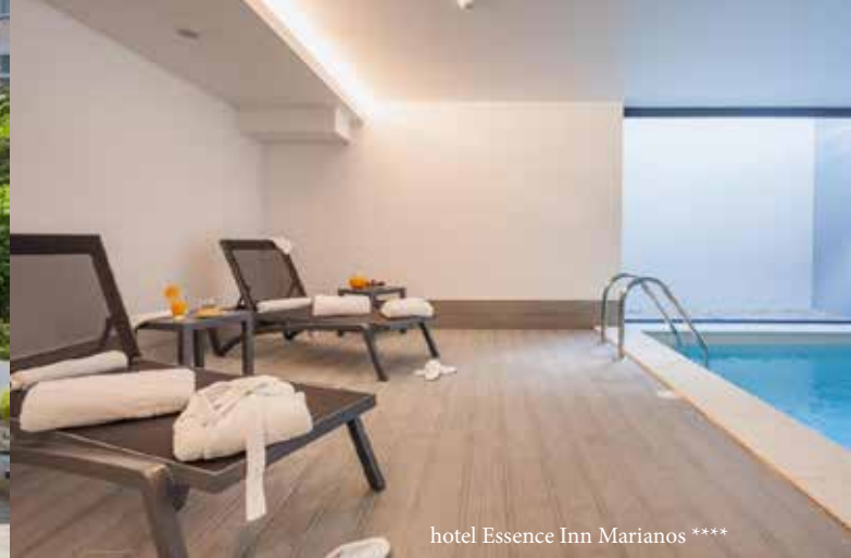
hotel Essence Inn Marianos ****