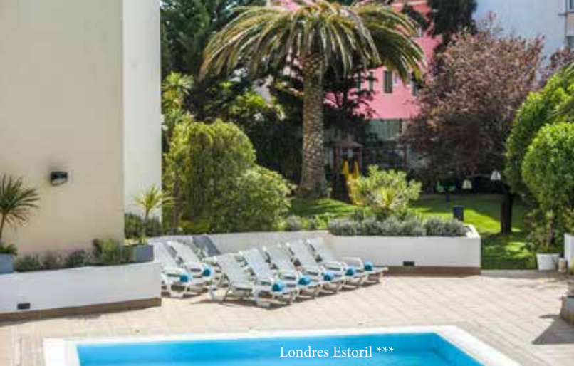
Londres Estoril ***