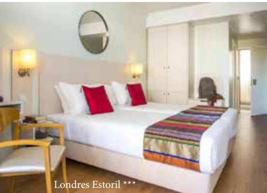
Londres Estoril ***