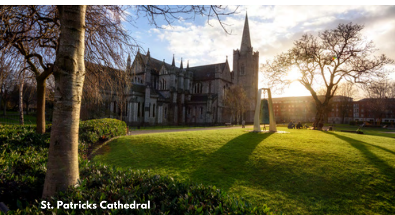
St. Patrick's Cathedral

Na het ontbijt in het hotel nemen we afscheid van Dublin. We laden onze bagage in de autocar en trekken naar onze laatste stop: Howth, een klein en gezellig havenstadje. Om nog even goed uit te waaien, staat er een korte Cliff Walk op het programma. Als afsluiter kunnen de liefhebbers zich tegoed doen aan een lekker stukje vis op de pier. Later die namiddag vertrekt de vlucht van Dublin Airport naar Brussels Airport Zaventem en zit je Ierse avontuur erop.