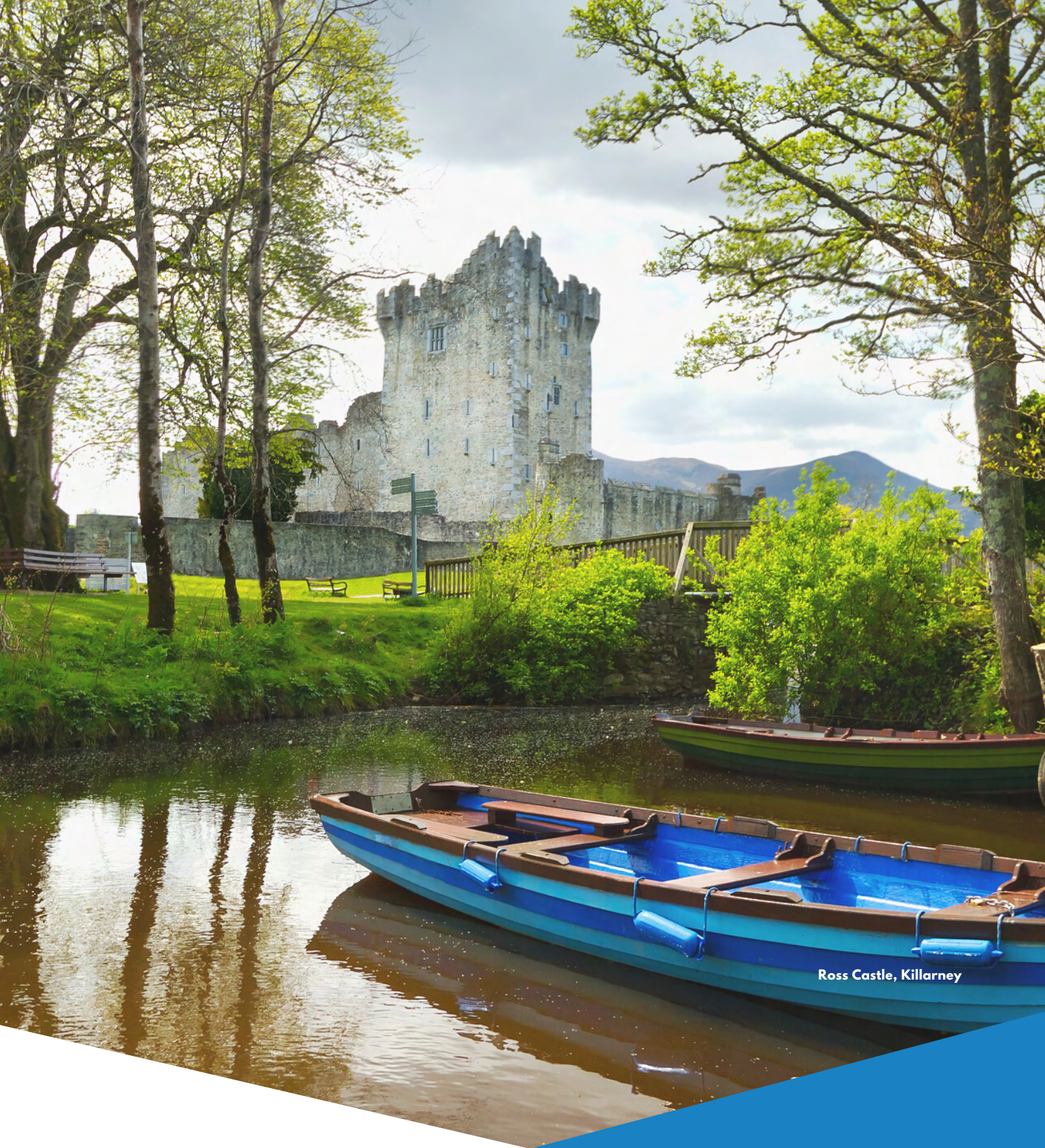
Ross Castle, Killarney