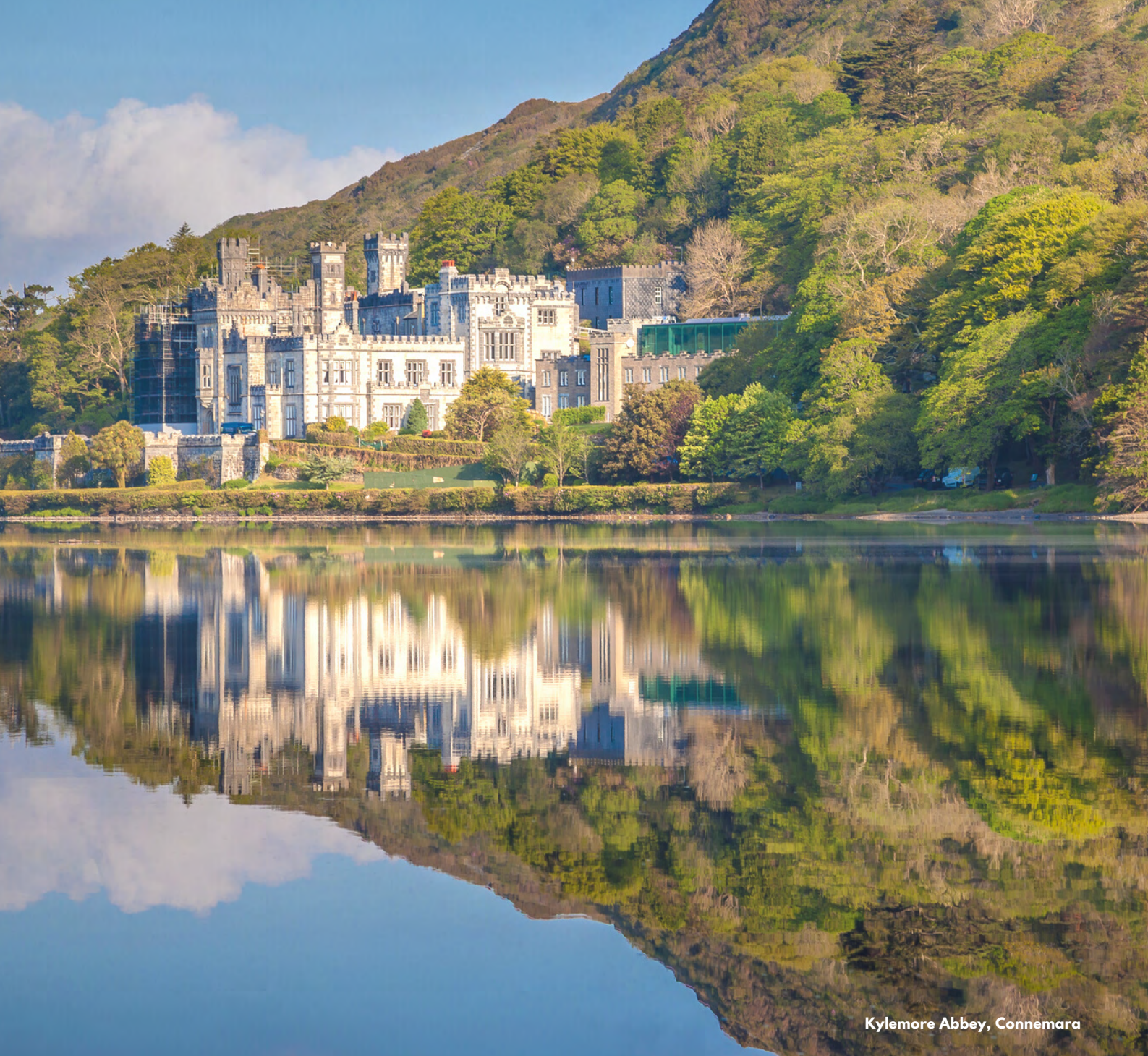
Kylemore Abbey, Connemara