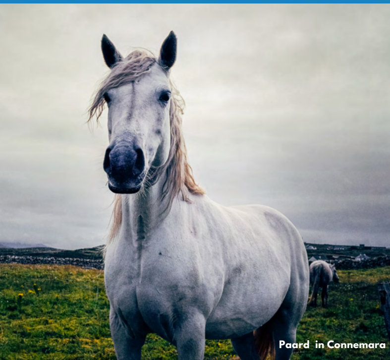
Paard in Connemara