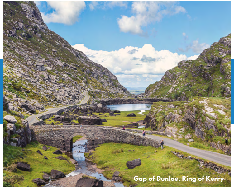
Gap of Dunloe, Ring of Kerry