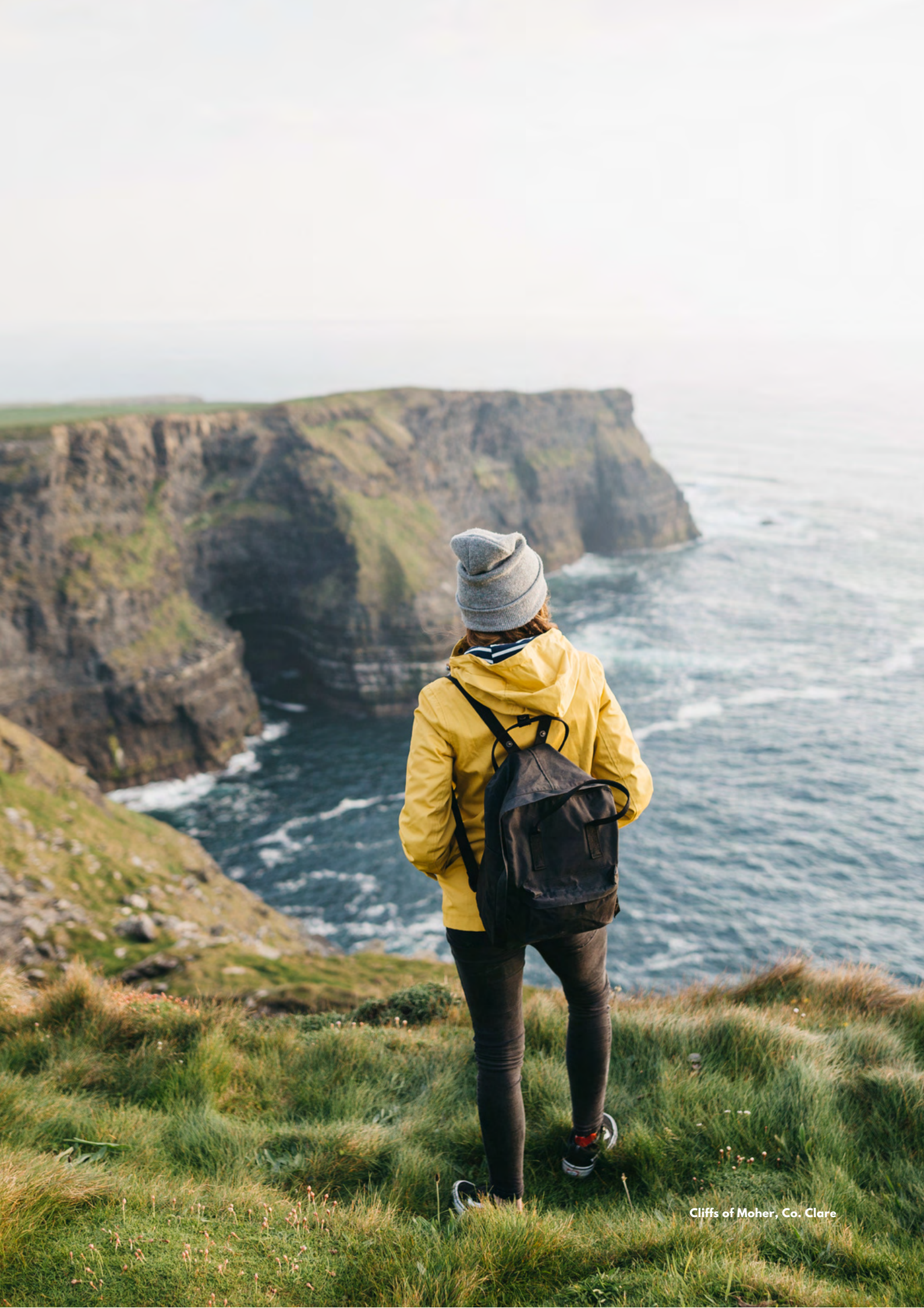
Cliffs of Moher, Co. Clare