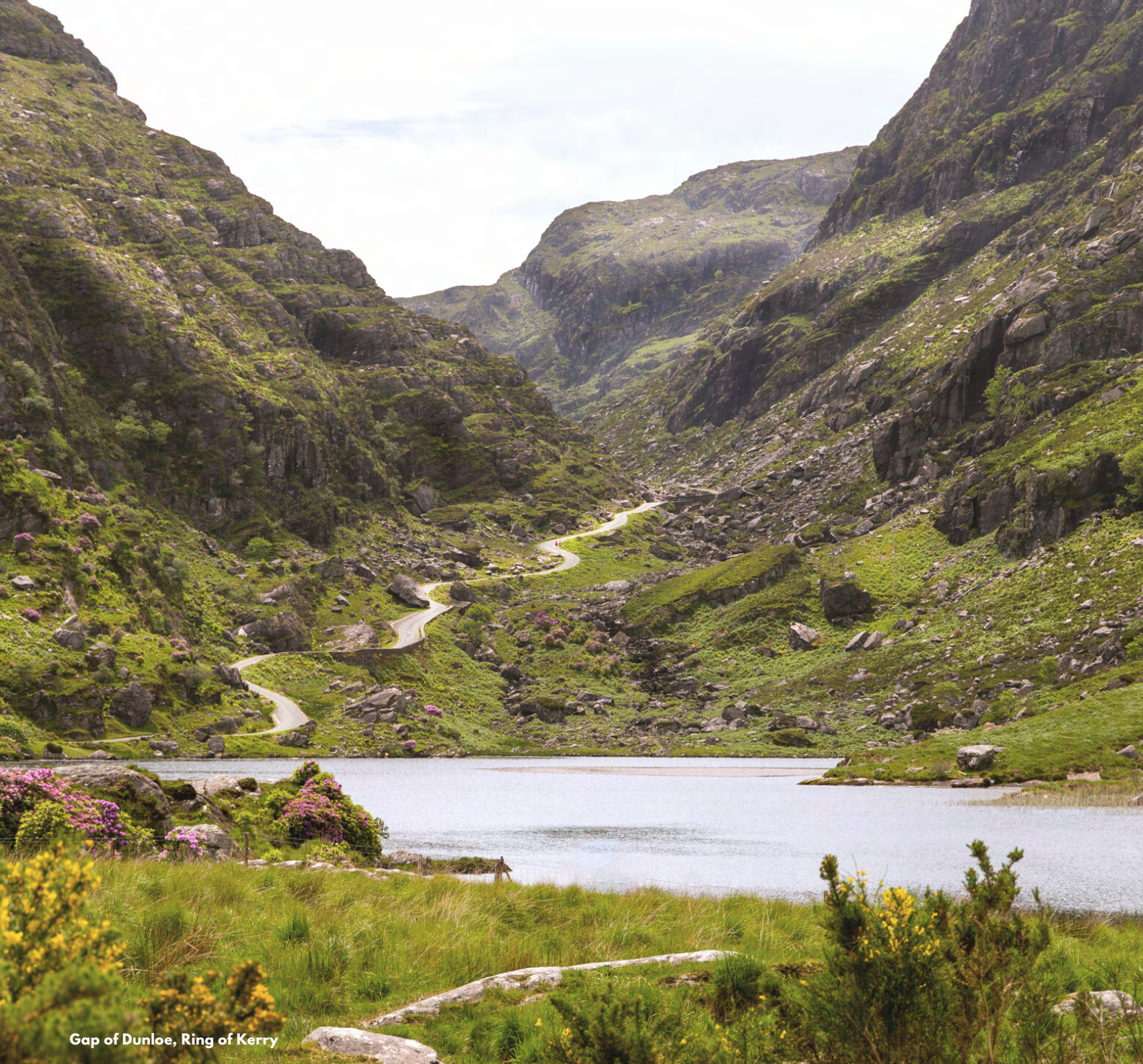
Gap of Dunloe, Ring of Kerry