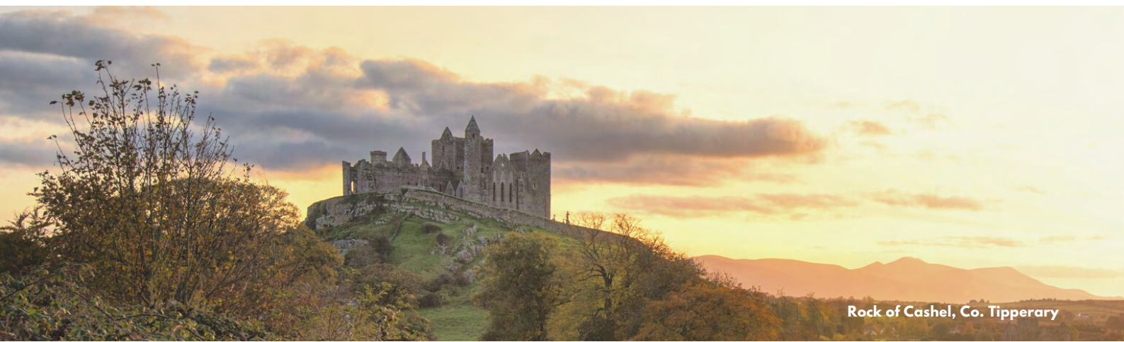
Rock of Cashel, Co. Tipperary

De dag start met een stevig Iers ontbijt. Vervolgens stappen we op de bus richting Killarney. Onderweg stoppen we aan het adembenemende Rock of Cashel. Deze iconische site is één van de topattracties van Ierland. De groep middeleeuwse gebouwen bevindt zich nabij het centrum van Cashel Town en biedt een prachtig uitzicht op de omliggende landerijen. Na een fotostop in Cahir zetten we onze weg verder richting het sprookjesachtige Muckross House en zijn tuinen. Overnachten doen we in een stijlvol hotel in het mooie Killarney.