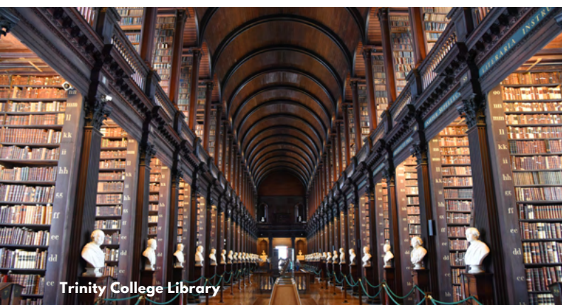
Trinity College Library