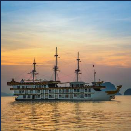
Vietnam & Cambodja