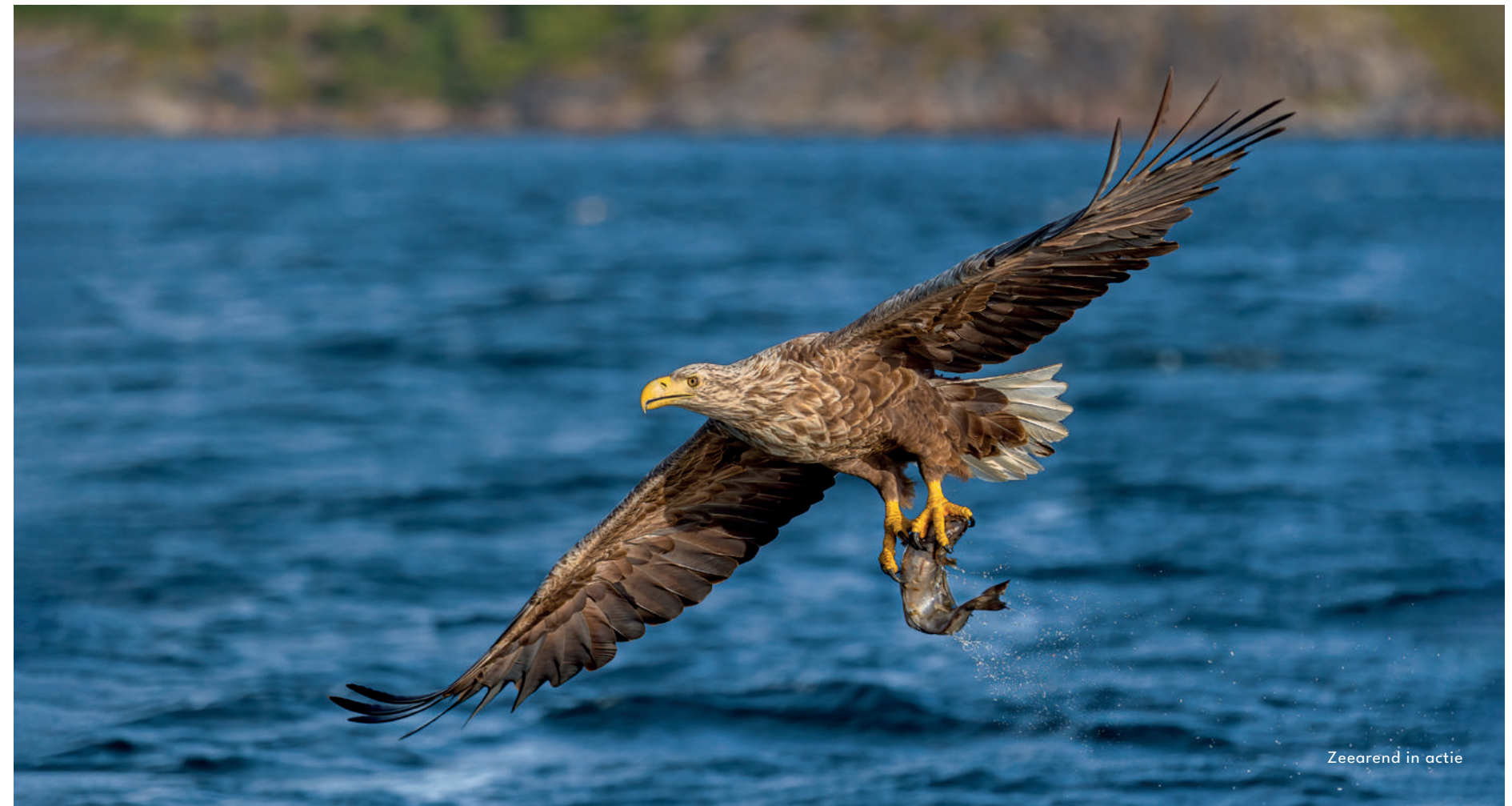
Zeearend in actie

We keren terug omstreeks 13-14u. Nadien ontdekken we weerom de romantische schoonheid van de door de Golfstroom beroerde Lofoten: pittoreske kleine vissershavens, rood geschilderde huizen (rorbu) en stokvis op houten rekken. Dit alles ontdekken we in het mooie plaatsje Henningsvaer met de leuke haven en gezellige plaatsjes. Genoeg te ontdekken! Diner en overnachting in het Thon Hotel Lofoten.