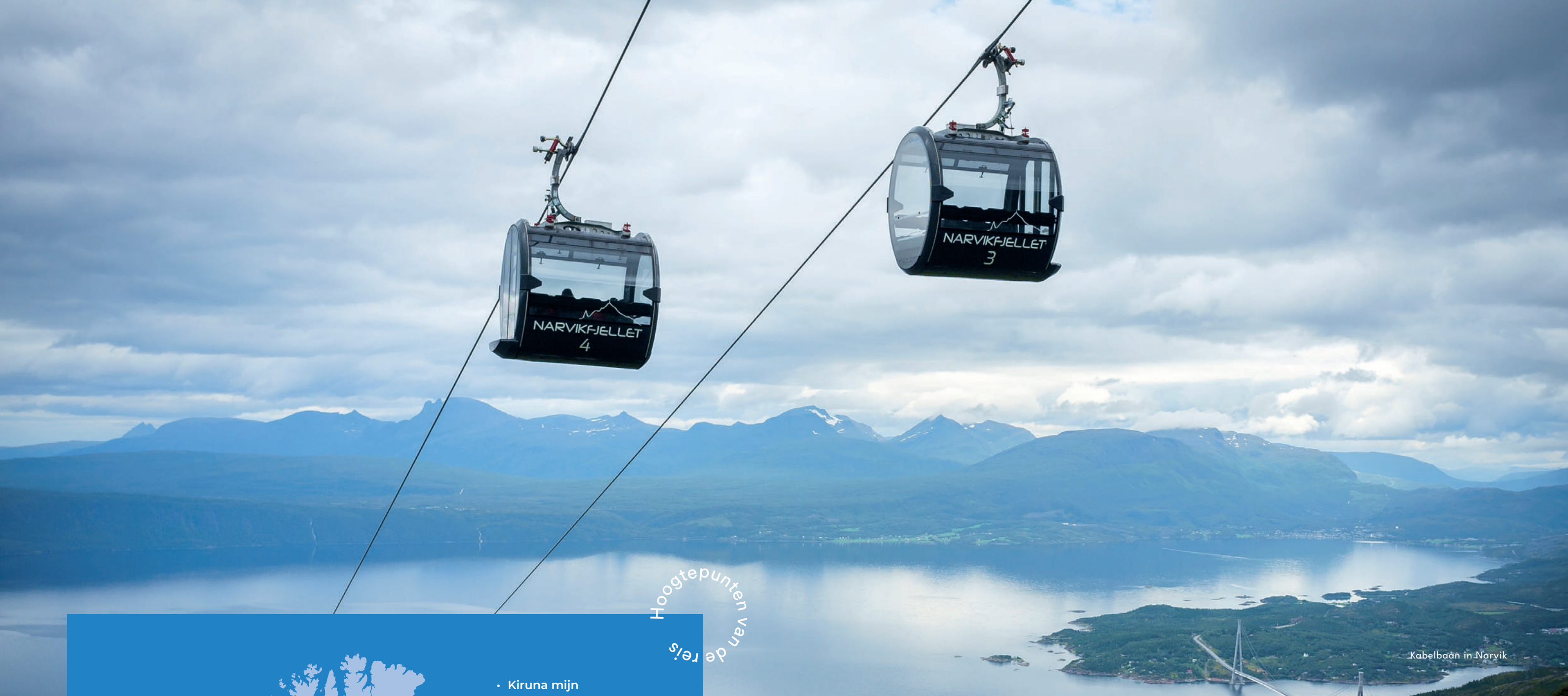
Kabelbaan in Narvik