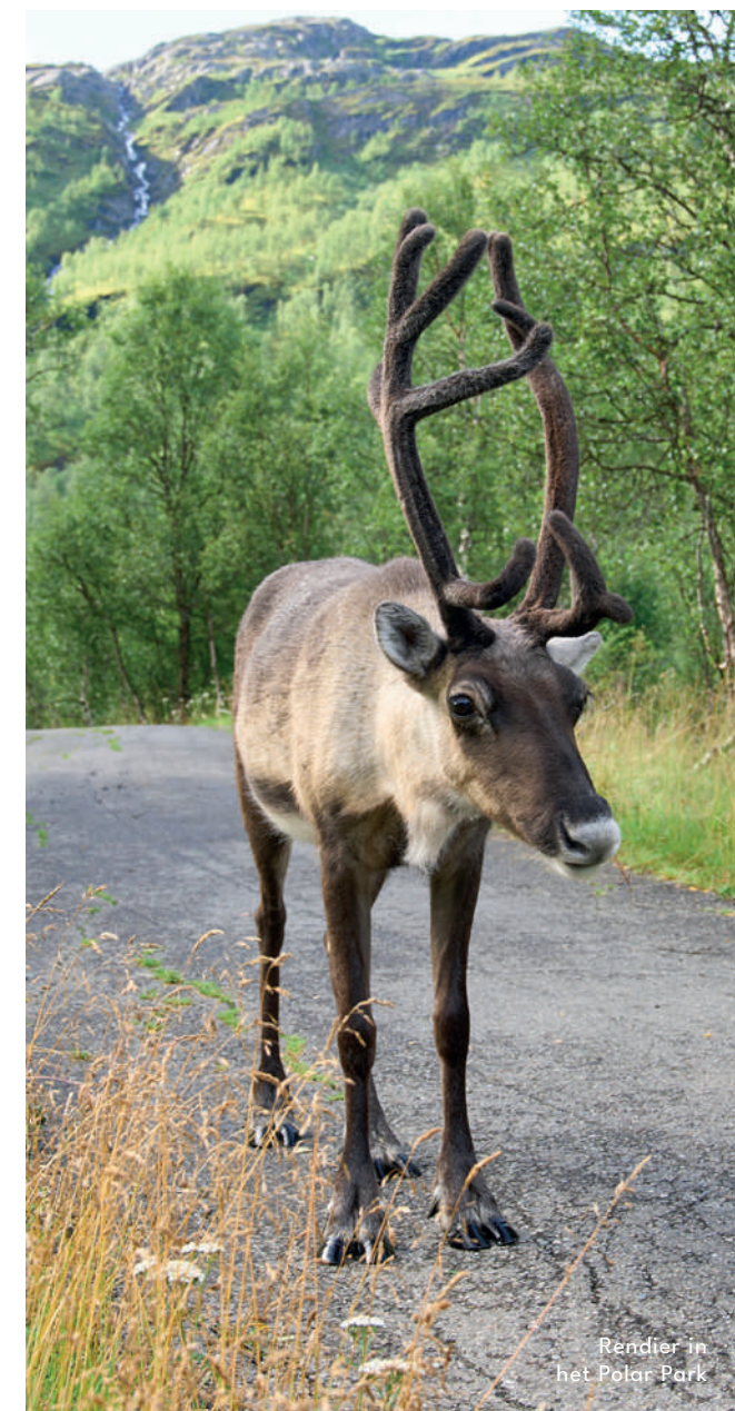
Rendier in het Polar Park

Avondmaal en overnachting geniet je in het Thon Hotel Lofoten. Dat hotel werd in het verleden uitverkozen tot hotel met het beste ontbijt van heel Noorwegen en net hier verblijf je 3 nachten.