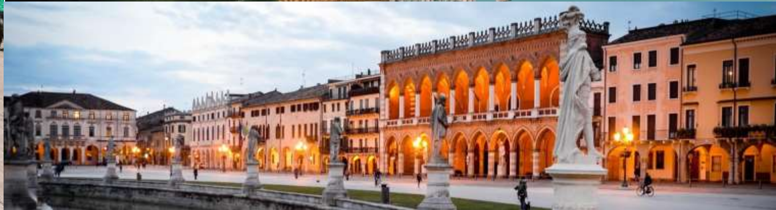
• Basiliek van Sant Antonio