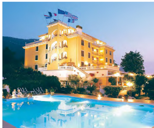
Tophotel met een superscore van 9.2/10

Avondmaal en overnachting in het 4**** superior hotel La Medusa . Je voelt je hier onmiddellijk thuis dankzij de familiale en uiterst gezellig sfeer.