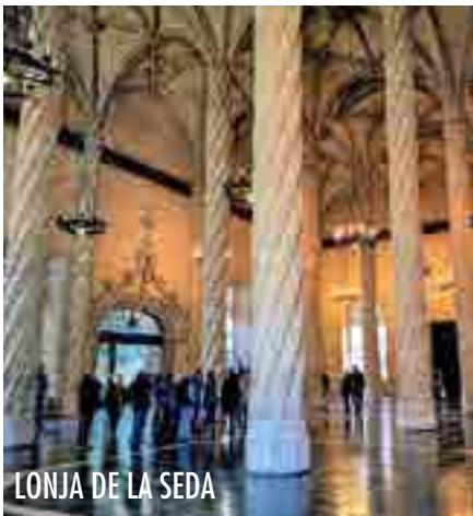
LONJA DE LA SEDA