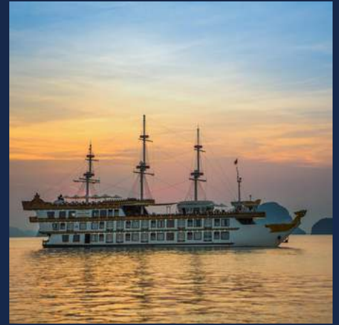
Vietnam & Cambodja